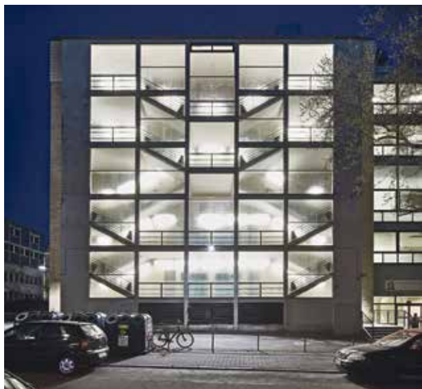
Ferdinand Kramer: Hörsaalgebäude I (1958) und II (1964) Universität Frankfurt.