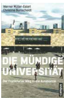
Werner Müller-Esterl/Christine Burtscheidt Die mündige Universität Der Frankfurter Weg in die Autonomie Frankfurt am Main, Campus Verlag 2015