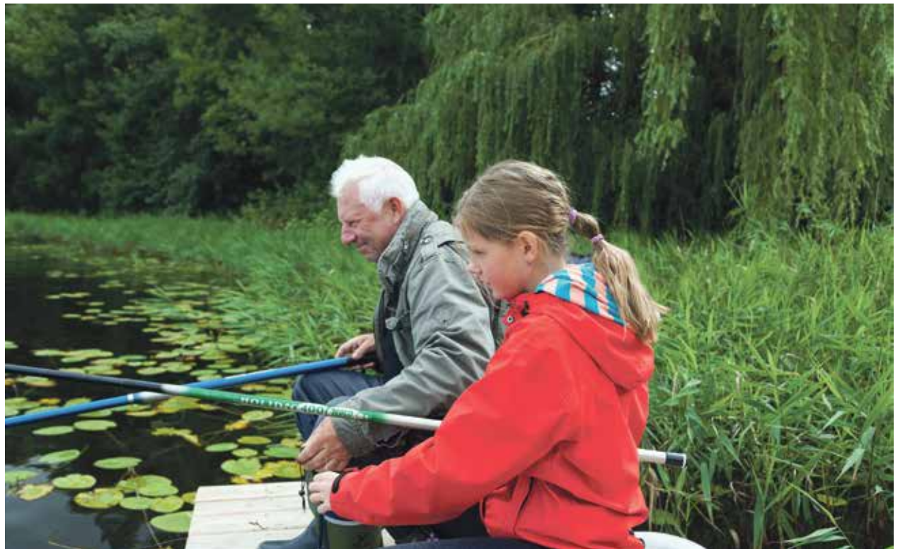
Mit dem „Leihopa“ was unternehmen – ein Zukunftsmodell?

Doch in welcher Größenordnung kommt dieses Phänomen derzeit vor? Handelt es sich vor allem um Männer, die das Empfinden haben, ihre Kompetenzen bei den eigenen Kindern nicht ausreichend realisiert zu haben, und das nun ehrenamtlich tun wollen? Oder geht es den Leihopas um die Möglichkeit, die Rente mit einem kleinen Zuverdienst aufzubessern? Für gleich drei große soziologische Debatten der Gegenwart könnte das Thema somit relevant sein: für die Debatte um die Vereinbarkeit von Familie und Beruf und die erzieherischen Versorgungslücken in den Familien, für die Debatte um die (Re-)Aktivierung der „jungen Alten“ für den Dienst an der Gesellschaft, und schließlich für die Debatte um prekäre Arbeitsverhältnisse, die keine ausreichende Altersvorsorge ermöglichen.