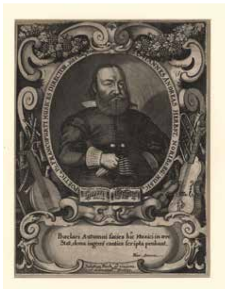
Sebastian Furck: Johann Andreas Herbst, Kupferstich, [Frankfurt am Main] 1635

Im Hinblick auf den 350. Todestag von Johann Andreas Herbst entstand die Idee, zu diesem Jubiläum zusammen mit Studierenden der Goethe-Universität eine Ausstellung zu gestalten. So wurde im Wintersemester 2015/16 das Magister-Hauptseminar: Meister des Frühbarock – oder: wer sind die Komponisten zwischen 1600 und Bach? angeboten. Als Kernthema hat sich während der Vorbereitung zu diesem