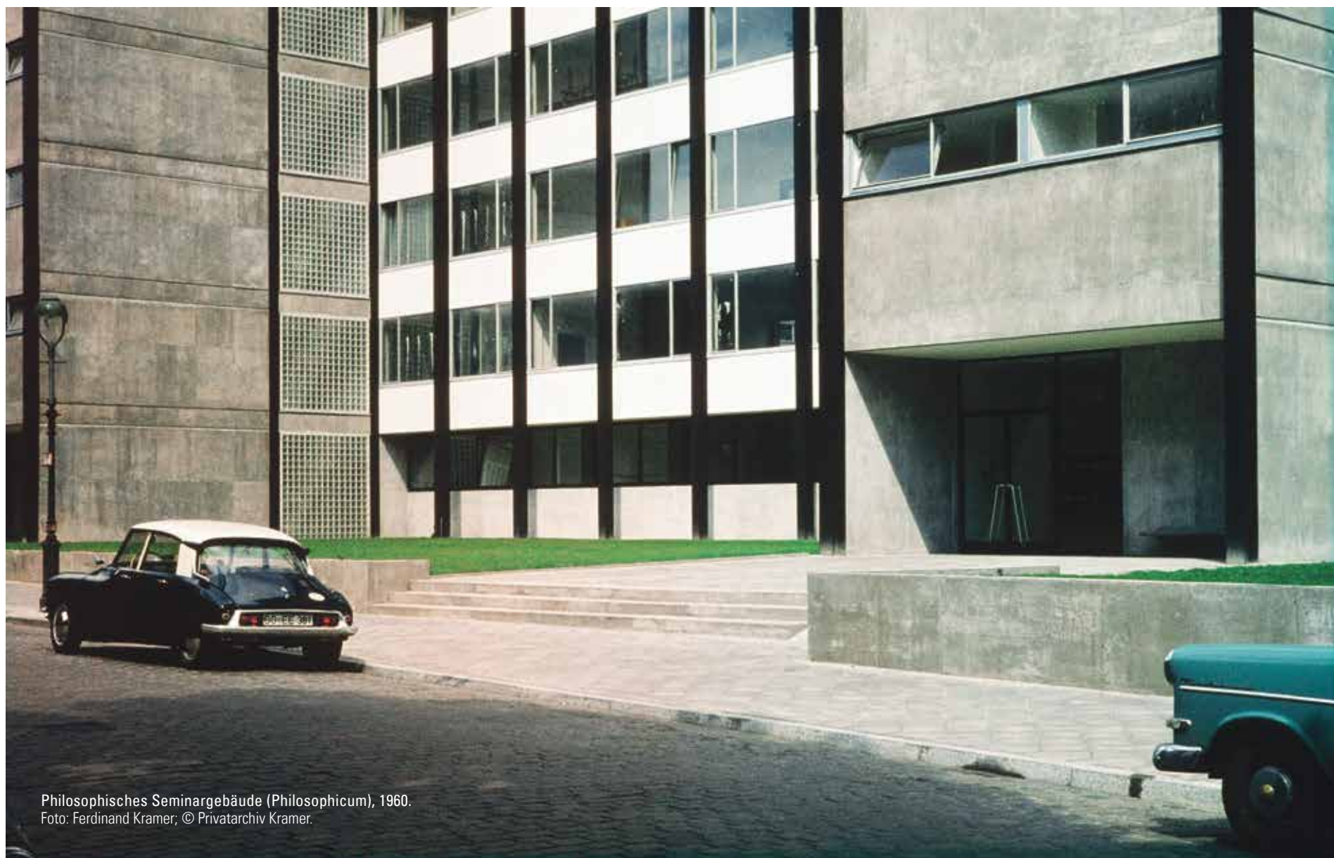
Philosophisches Seminargebäude (Philosophicum), 1960.